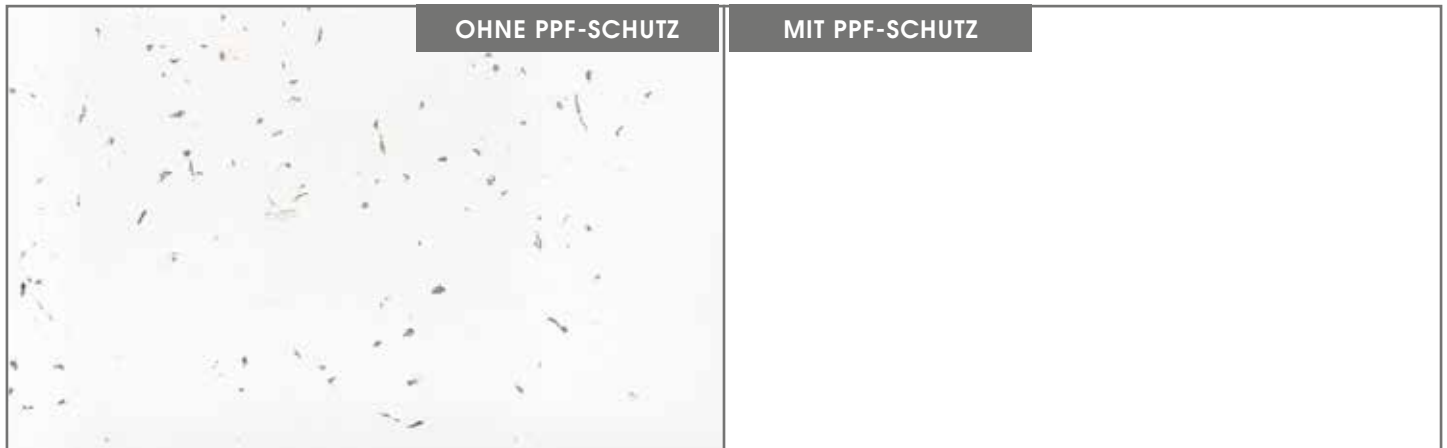
* Die Abbildung zeigt einen Splittschuss-Test auf einer Oberfläche mit bzw. ohne installiertem PPF